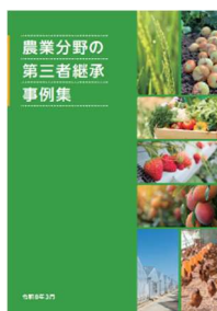
図. 事例集の掲載内容

土地利用型農業、施設園芸、果樹、畜産の各営農類型について、法人間における第三者継承の事例を整理しました。具体的な継承のプロセス、継承を進める上でのポイント、成果と今後の展望の観点から整理しています。