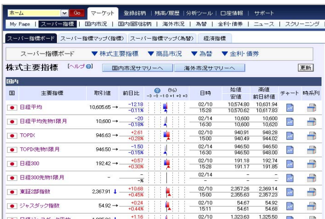
【スーパー指標ボード】 ※拡大版 (利用料無料)