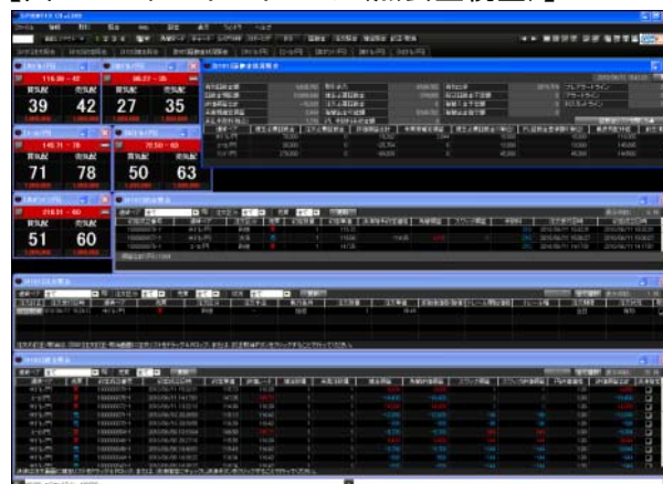
【図2:カスタマイズイメージ(照会重視型)】