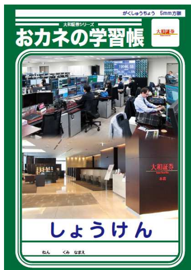
協力：ショウワノート株式会社